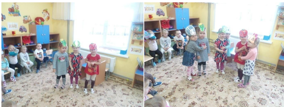
Инсценировка «Сказка про овощи»

Продукты проекта: макет «Как растут овощи», выставки творческих работ детей, мастер-класс по изготовлению макета, осенний праздник, презентация проекта.