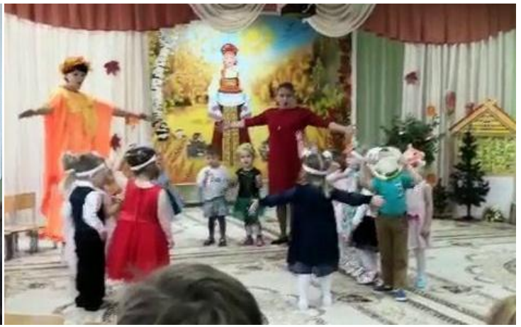
Инсценировка песни «Огородная - хороводная»