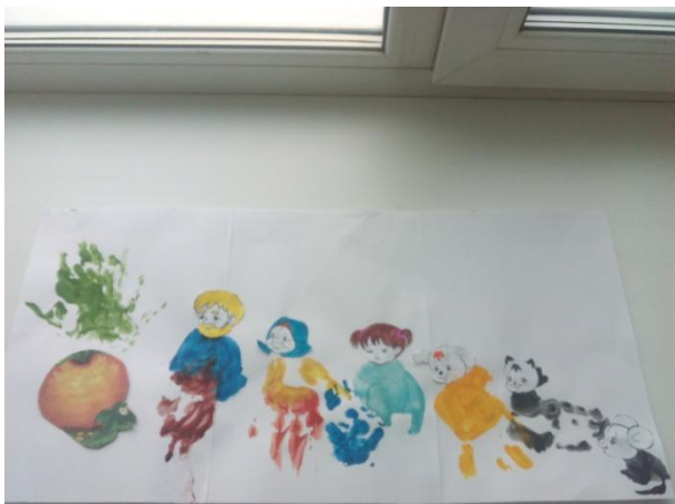
Рисованная сказка ладошками