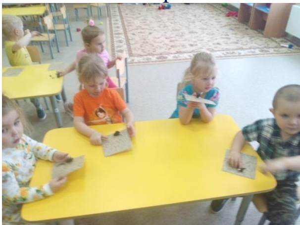
Мы подружку репке Вместе смастерили...