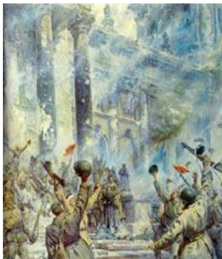
П.А. КРИВОНОГОВ "ПОБЕДА" (ФРАГМЕНТ)

Болью и ненавистью к тем, кто затеял все это, пропитан даже воздух в картине.