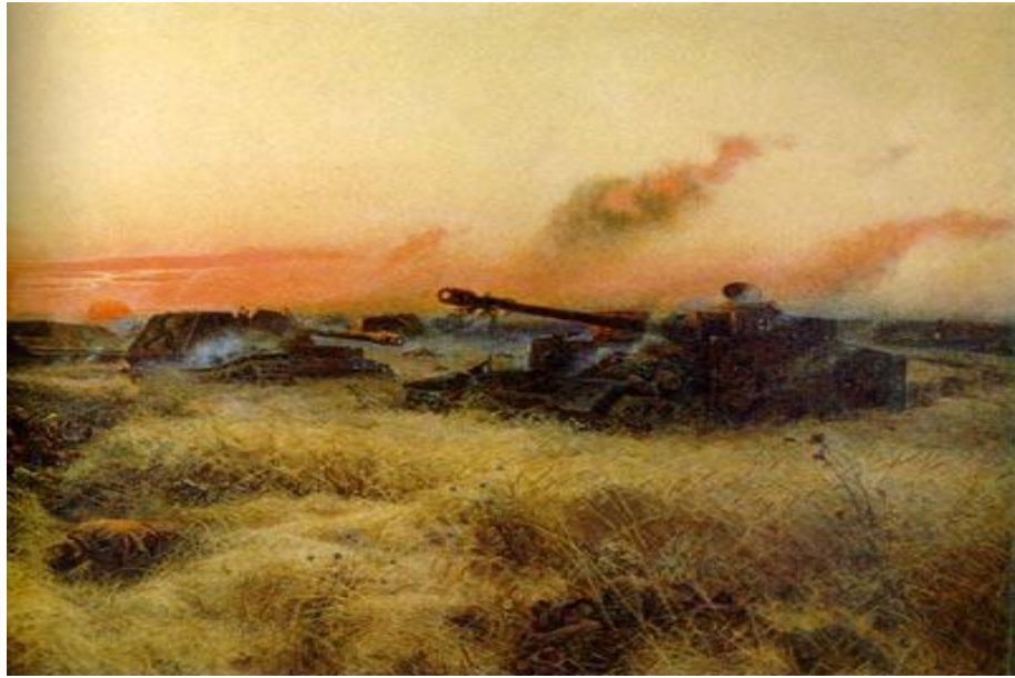
П.А. КРИВОНОГОВ "НА КУРСКОЙ ДУГЕ" (ФРАГМЕНТ)

...над русским полем, воспетым во многих народных песнях, поднимается розовая заря. Но мирный сельский пейзаж нарушен тяжелыми танками. Чудесная поэзия летнего утра разбита грубой прозой войны. Идет бой, но это не тот бой, который воспевает романтику войны, а жестокий и беспощадный, коверкающий землю, застилающий небо клубами дыма. Идет бой, который в будущем предрешит не только судьбу Курской дуги, но и судьбу всей России, всего мира.