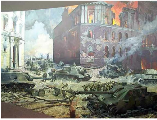
Берлина (номер 2).

Художник детально воспроизводит атмосферу уличных боёв: горящие здания, дым, подбитая техника, советские солдаты готовятся к решающему штурму.