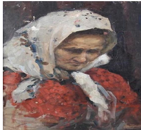
«Вести с войны»