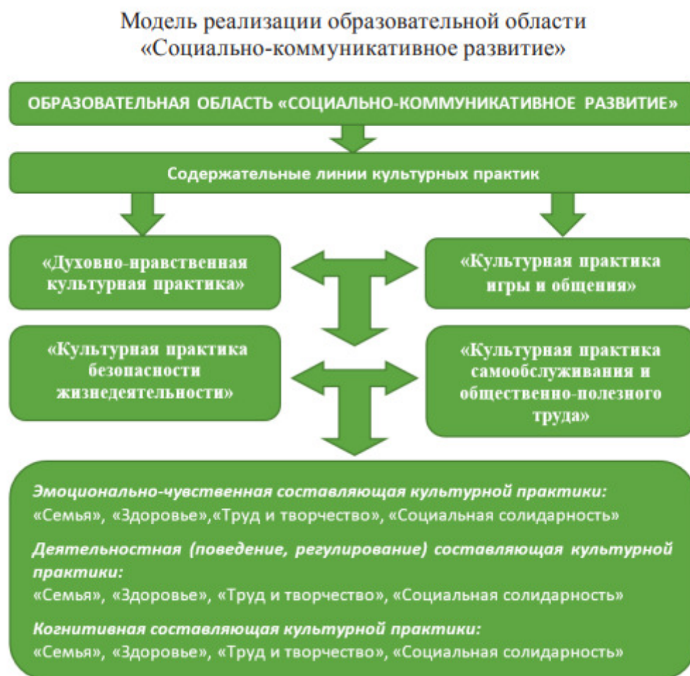
Рисунок 1. Модель реализации образовательной области «Социально – коммуникативное развитие»

Образовательная область «Социально-коммуникативное развитие»