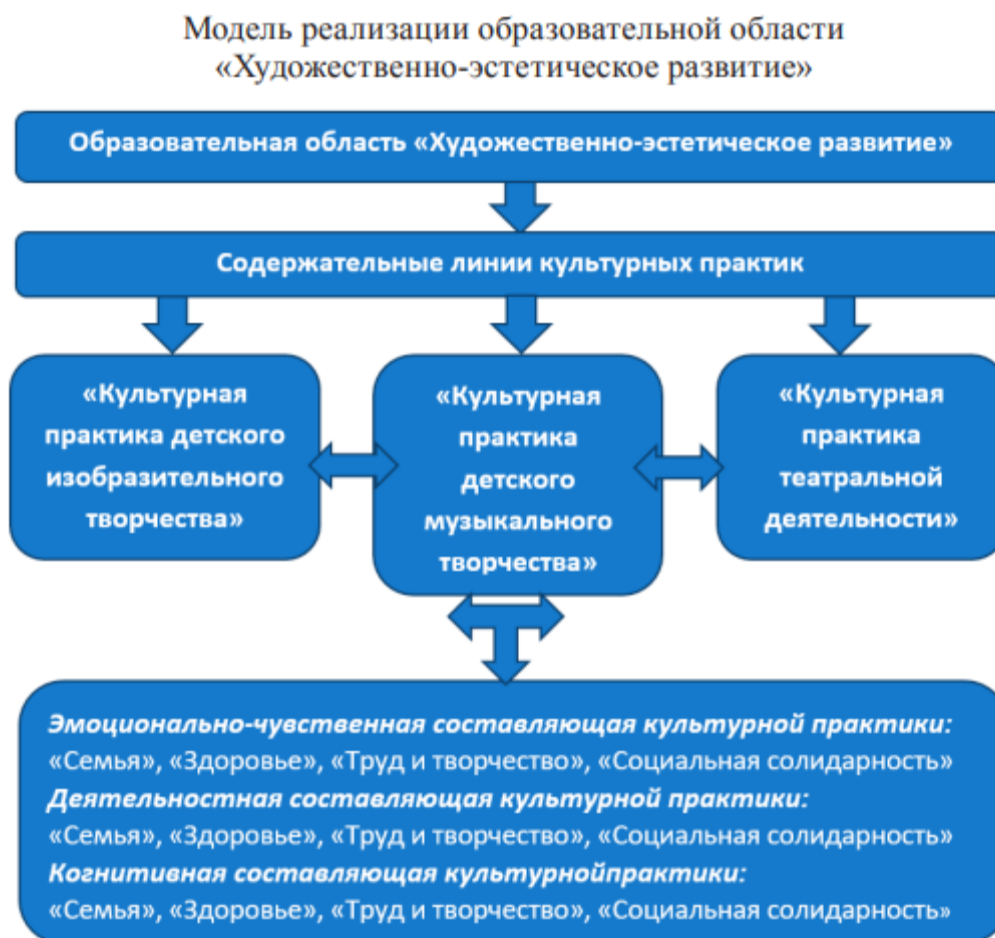
Рисунок 4. Модель реализации образовательной области «Художественно – эстетическое развитие»