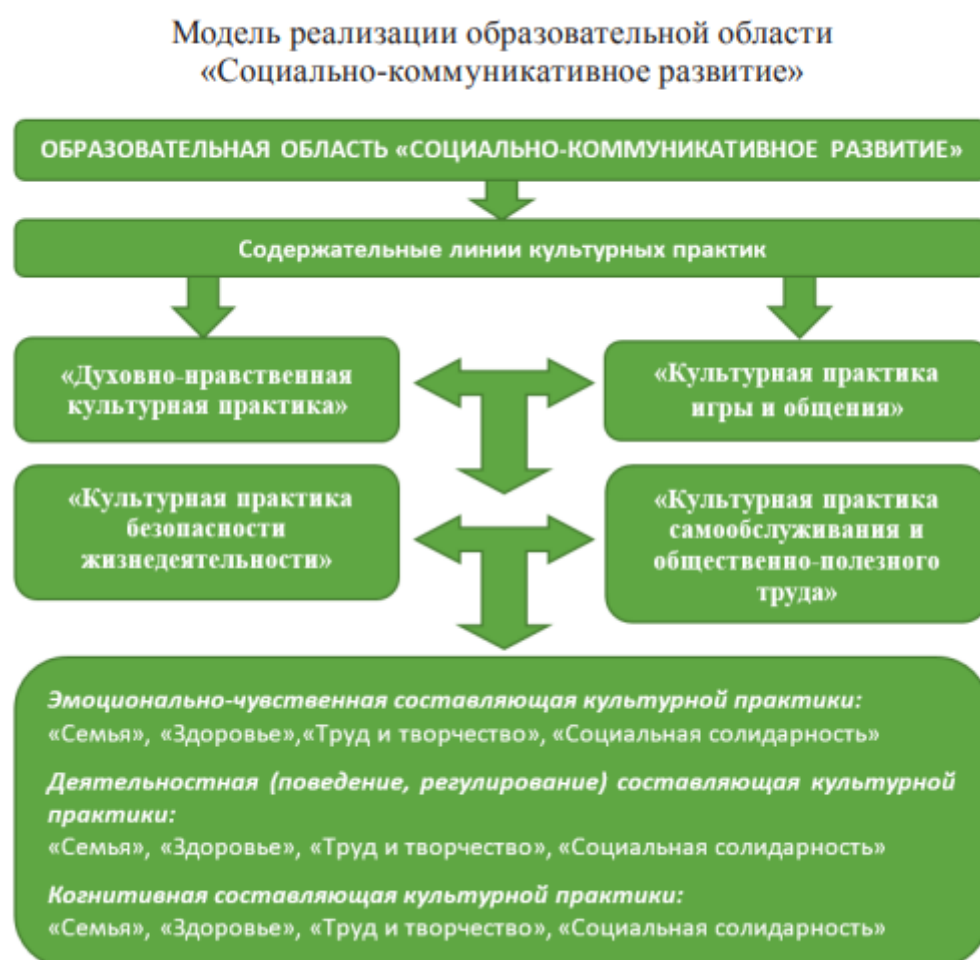
Рисунок 1. Модель реализации образовательной области «Социально – коммуникативное развитие»

Образовательная область «Социально-коммуникативное развитие»