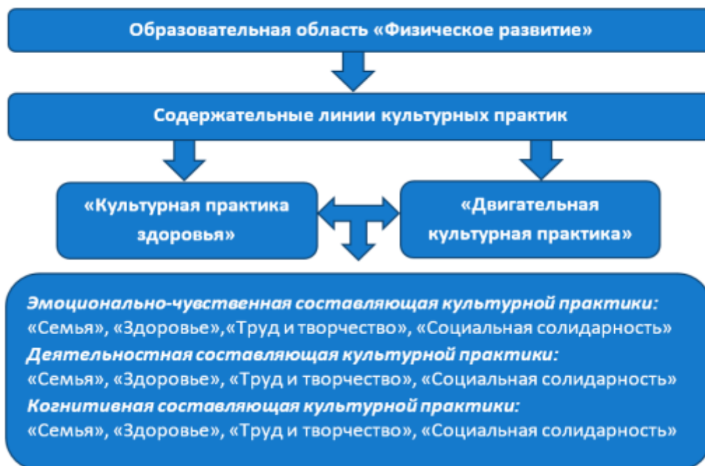
Рисунок 5. Модель реализации образовательной области «Физическое развитие».