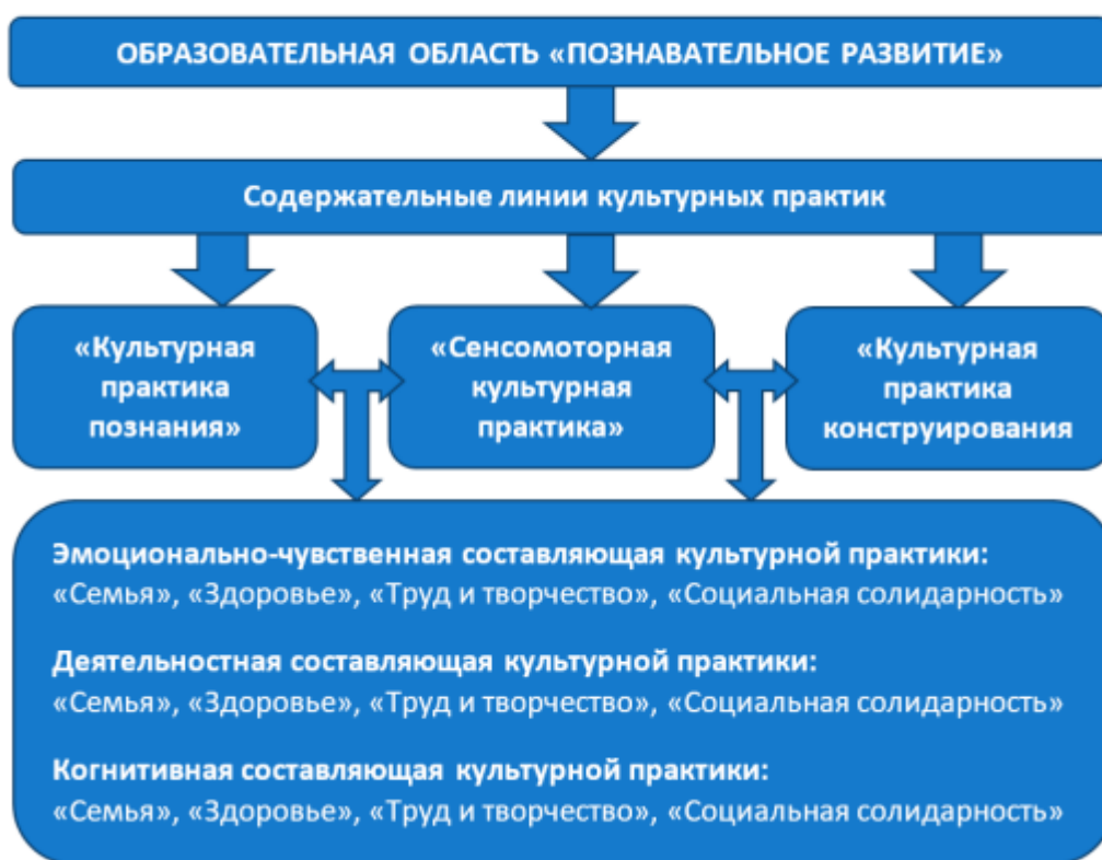
Рисунок 2. Модель реализации образовательной области «Познавательное развитие»

Модель реализации образовательной области «Познавательное развитие»